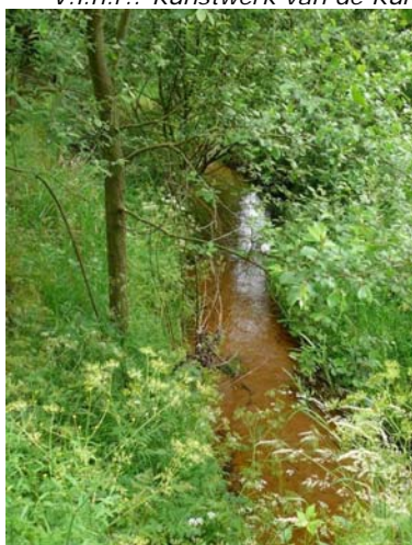
De (verlegde)beek over het Leutink