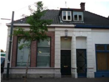
Deze kleintjes zijn sowieso ten dode opgeschreven.

– in de woorden van Brakman ‘het onlieflijke stadje E.’ Laten we deze entree niet ‘onlieflijker’ maken door te kiezen voor goedkope, weinig vernieuwende nieuwbouw, maar verrijken met goed gerenoveerde oudbouw of daadwerkelijk vernieuwende architectuur. ■