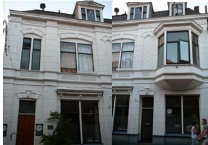
Het witte pand, nummer 19, dat gespaard wordt in de zogenoemde ABC-variant.