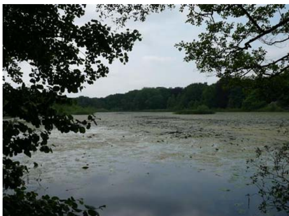
het prachtige Lonnekermeer