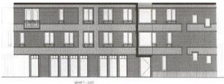
De Noorderhagen straks – bij algehele nieuwbouw