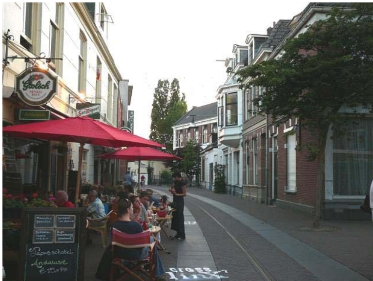
De Noorderhagen nu - westzijde.