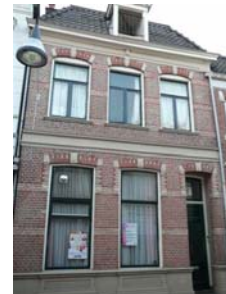
Het pand op nummer 21, dat D66 graag wil behouden.