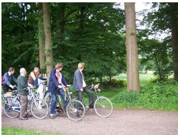
D66 Enschede onderweg – een fotomoment